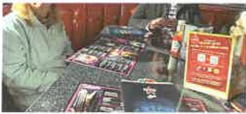
Restaurant « Le Memphis »

« Nous avons passé une journée au Polygone de Béziers pour faire les achats de Noël. Chacun a pu se diriger vers les magasins souhaités.