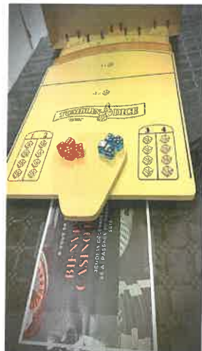
Jeu « Tumblin-Dice

Journée très réussie et appréciée par tous ! »