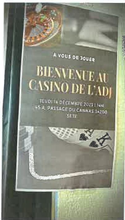
Affichage de bienvenue

« Le jeudi 14 décembre, l'équipe de l'ADJ a recréé un casino version miniature avec une mise en scène et mise en place digne des plus grands casinos de Las Vegas ! A notre arrivée, nous avons été accueillis avec un cocktail de fruits fait maison.